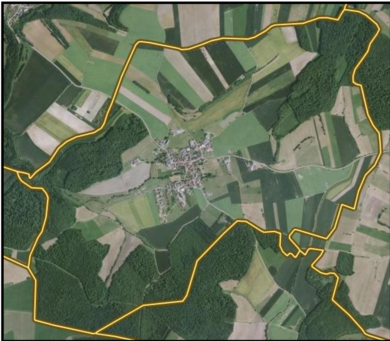
Figure B : Vue aérienne de la commune de Ritzing

La commune de Ritzing compte 163 habitants (recensement 2018 - INSEE, 2015) et son territoire représente une superficie de 615 Ha.